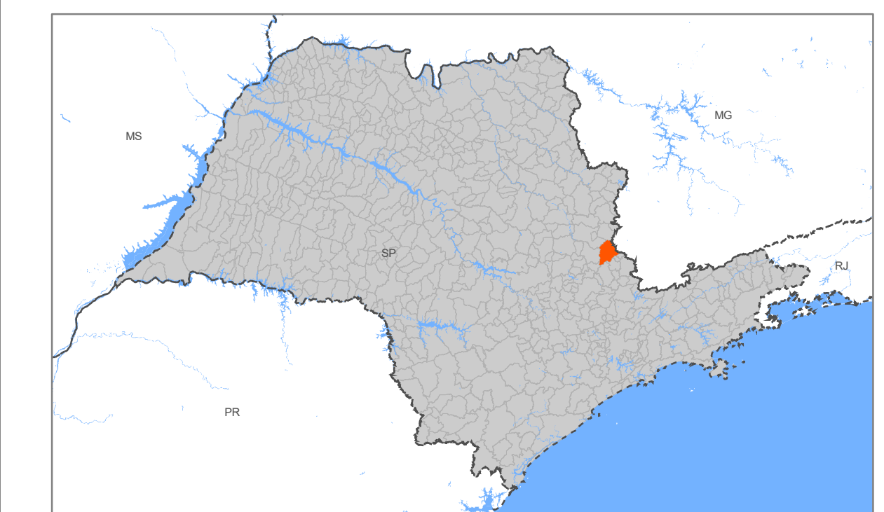
SITUAÇÃO DO MUNICÍPIO NO ESTADO DE SÃO PAULO

Desenvolvimento e elaboração: Prefeitura Municipal de Itapira-SP Bases cartográficas e fontes: Carta Internacional do Milionário e Mapa Digital de Setores Carteiros 2010, IBGE ANA, 2019/CETEB, 2018 / SGB Open Street Map, 2021 Prefeitura Municipal Coordinate System: